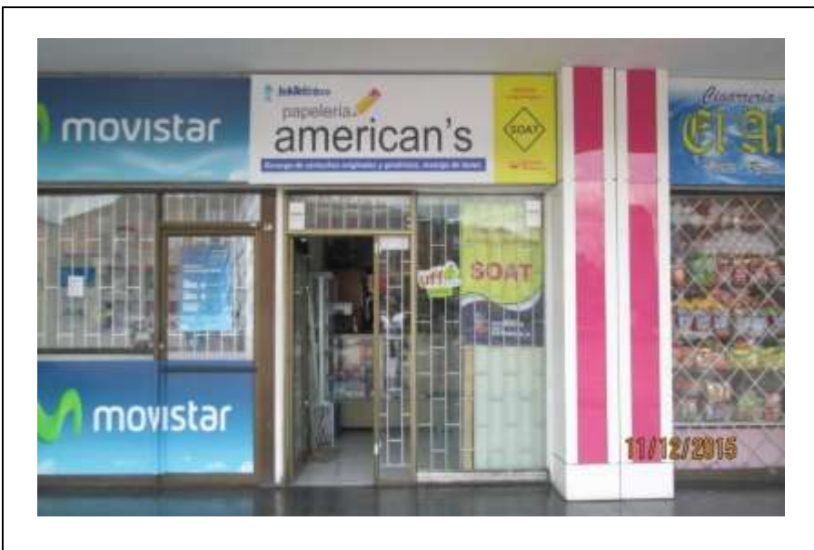
Fotografía No. 2: Avisos del establecimiento PAPELERIA AMERICANS, No cuenta con Registro de Publicidad Exterior Visual y no está permitido colocar avisos pintados o incorporados en cualquier forma a las ventanas o puertas de la edificación, ubicado en la Calle 47 B Sur No. 24 B – 33 local 2029.